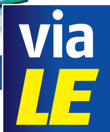
Titelseite Ausgabe 1/2023