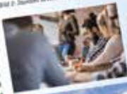
Bild 1: Weiterbildung für Mitarbeiter in der betrieblichen Akademie Musterfirma Bild 2: Standort in Musterstadt

Dadurch erhalten alle Mitarbeiter die gleichen Chancen für nötige Teilkompetenzen.